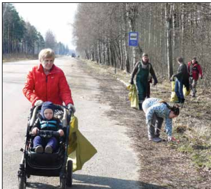
► turpinājums no 4. lpp.